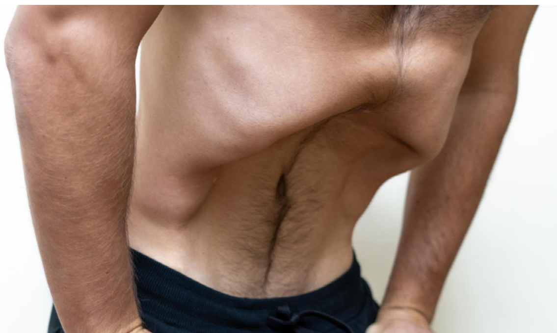
Рис. 1. Выполнение упражнения «уддияна» Fig. 1. Performing the “uddiyana” exercise

сагиттальном синусе головного мозга. Поскольку эффективный венозный дренаж имеет основополагающее значение для здоровья мозга в условиях нормы и патологии [9, 24], исследователи могут использовать эти данные для изучения влияния дыхательных упражнений на клинические показатели и венозный отток.